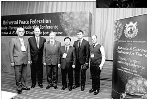
2014. La Conferința Eurasia-Europe Dialogue for Peace: Eurasia-Europe Leadership