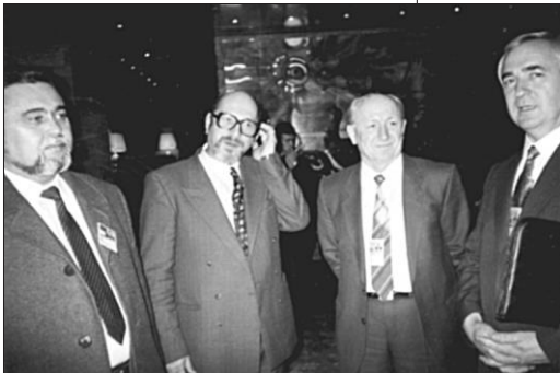
1994. Budapesta, Ungaria