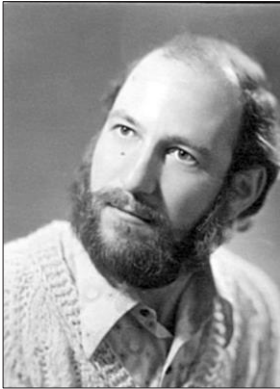
1974-1977 Doctorand la Universitatea de Stat „M.V. Lomonosov”, or. Moscova