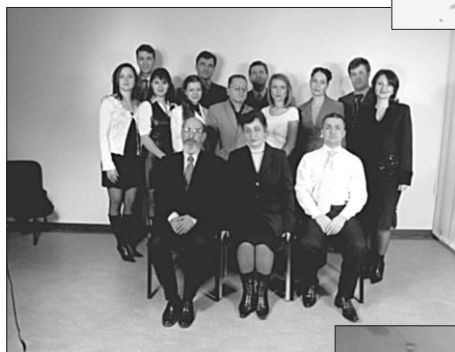
2011. Împreună cu profesorii Catedrei Drept Internațional, USM