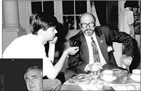
1993, Sinaia, România