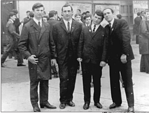
1968-1973. Student la Facultatea de drept, USM