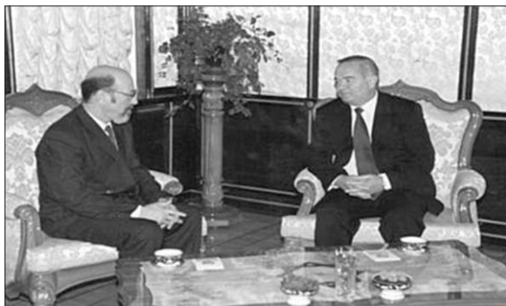
1998. Ambasador Extraordinar și Plenipotențiar al RM în Uzbekistan, Tadjikistan, Kârgâzstan, înmânarea scrisorilor de acreditare, Tașkent