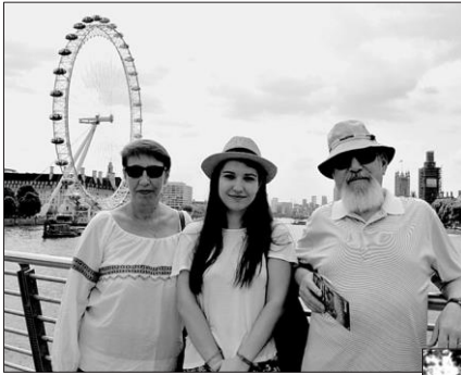
Împreună cu familia, or. Londra