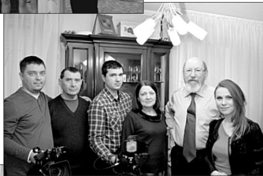
2014. Interviu pentru emisiunea TV Moldova „Destine de colecție”