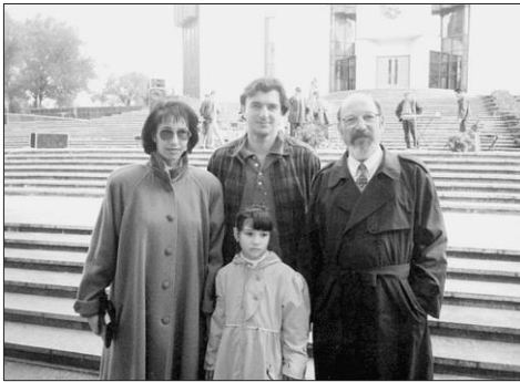
1997. Împreună cu familia la Ziua orașului, Chișinău