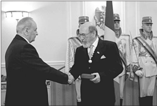
27 noiembrie 2014. Înmânarea Ordinului Republicii Moldova de către Președintele Republicii Moldova Nicolae Timofti