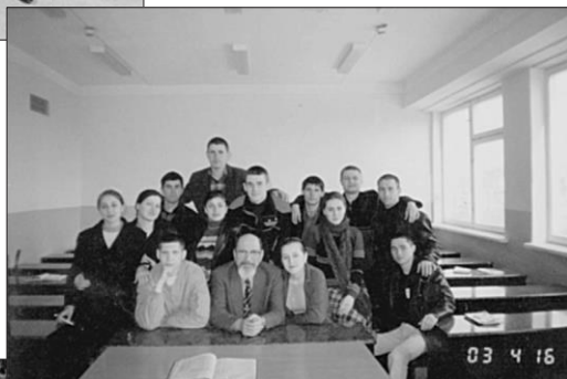
Împreună cu studenții Facultății de drept a USM