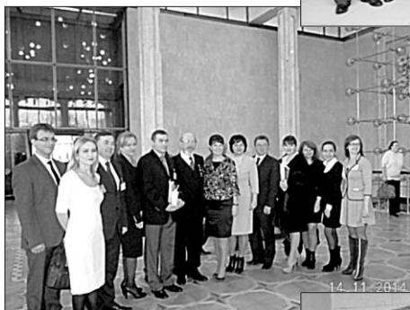
14 noiembrie 2014. Jubileul de 70 de ani, Palatul Republicii, Chișinău