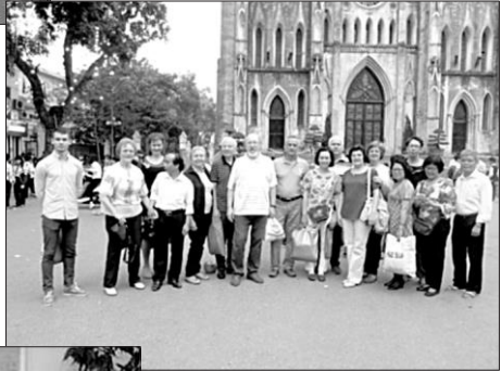
În or. Hanoi, Vietnam, la invitația foștilor studenți ai USM