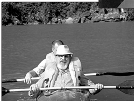
2012. La odihnă în Vietnam, Golful Ha Long