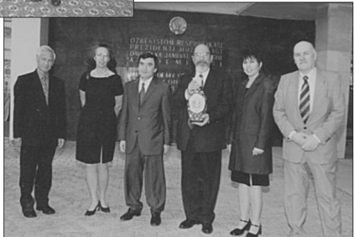
2001. Înmânarea Diplomei Titlul Profesor Onorific al Academiei Construcție de Stat și Socială pe lângă Președintele Republicii Uzbekistan. Împreună cu Rectorul Academiei, șefa Departamentului Drept International Public și Ambasadorul Georgiei.