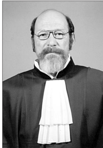
1995-1998. Judecător la Curtea Constituțională a Republicii Moldova