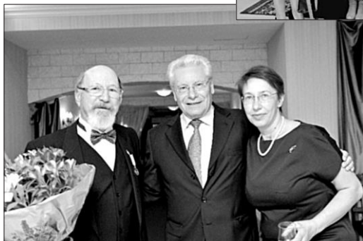
14 noiembrie 2014. Împreună cu Petru Lucinschi