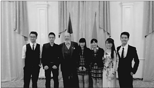
2013. La recepție de Ziua Proclămării Independenței a Republicii Socialiste Vietnam, Hotelul „Codru”, Chișinău