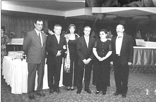
1 septembrie 2000, Ziua Independenței Uzbekistanului